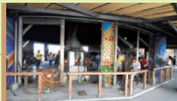
Glass Factory 유리공방