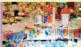
Shopping center 쇼핑센터

‘류큐 유리’의 매력을 맛볼 수 있는 시설에서 친한 친구와 가족들과 함께 즐기세요.