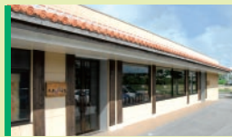
Ryukyu bi-doro 류큐 비도로