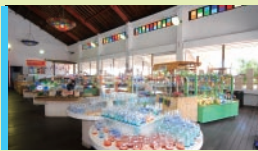
Jungla-ya, an outlet shop selling glass items 유리 아웃렛샵 ‘장가라야’