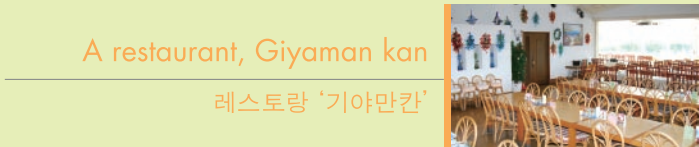
A restaurant, Giyaman kan 레스토랑 ‘기야만칸’