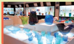
Ryukyu Glass Museum 유리갤러리