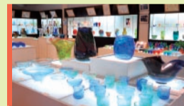
玻璃长廊 玻璃藝廊

各式各样的设施让您全面感受「琉球玻璃」的魅力无限！ 无论好友同行或家人出游，都是最佳选择。