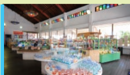
玻璃名品特惠商店“JYANGARAYA” 玻璃特價商品專賣店「Jyangaraya」

各式各样的设施让您全面感受「琉球玻璃」的魅力无限！ 无论好友同行或家人出游，都是最佳选择。